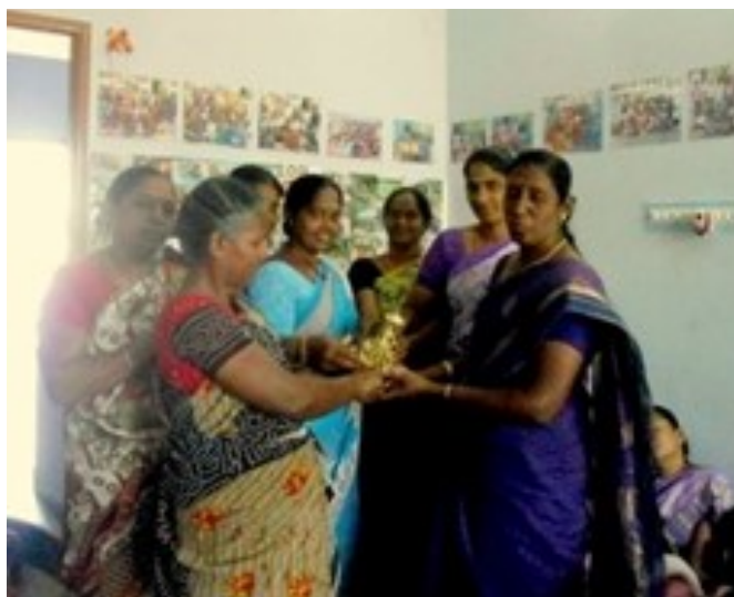
Les filleules se sont cotisées pour offrir un cadeau à celles qui ont quitté l'association

L'antenne d' Antsirabe a vu des parrainages supplémentaires portant à 48 le nombre de familles, soit 7 de plus que l'année dernière.