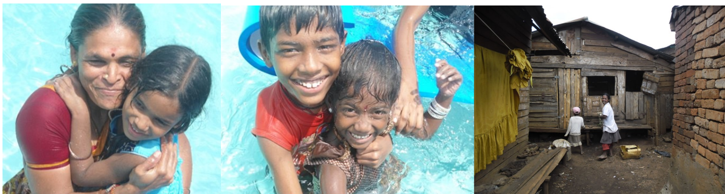
Sortie à Pogoland