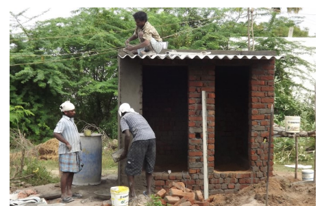
Construction de toilettes par deux parrains et leur épouse indienne